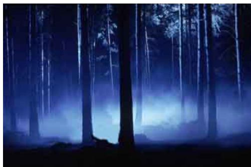
(Obrázek z hradního archivu – vstup do lesa)