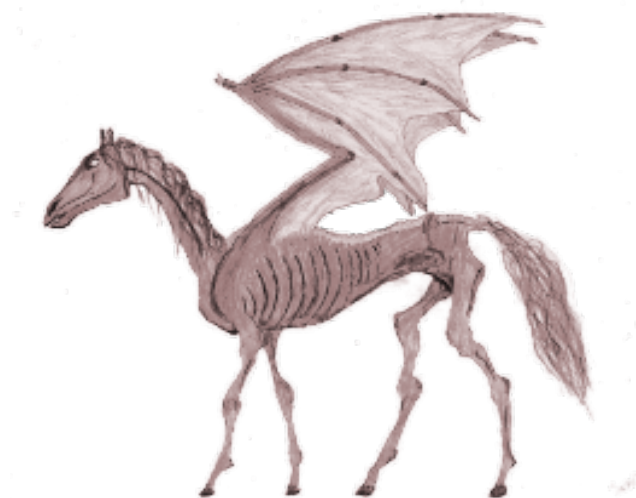
(Autorská tvorba, kombinace tužka-Gimp - testrál)

Testrálové jsou v klasifikaci Ministerstva kouzel řazeni pod okřídlené koně a označení jako XXXX, tedy potenciálně nebezpečné tvory. Do skupiny s nimi patří Abraxaský plavák, aethonský okřídlený kůň (označen pouze jako XX z důvodu jeho atraktivního vzhledu) a granijský okřídlený kůň (XXX).