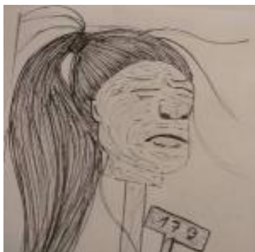
(Obrázek ze soutěže Hlavy na kůlech II/II - autor Nicolette Marique Leroy )