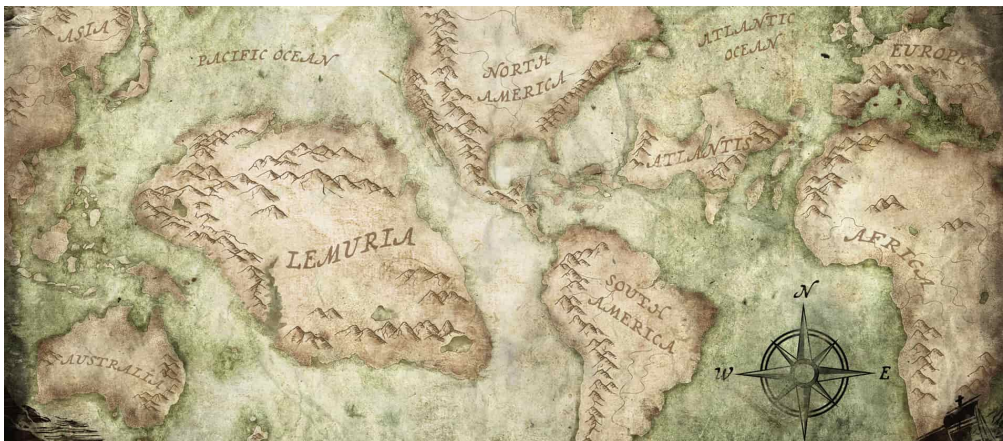
Atlantida i Lemurie zobrazeny mudlou na jednom obrázku.