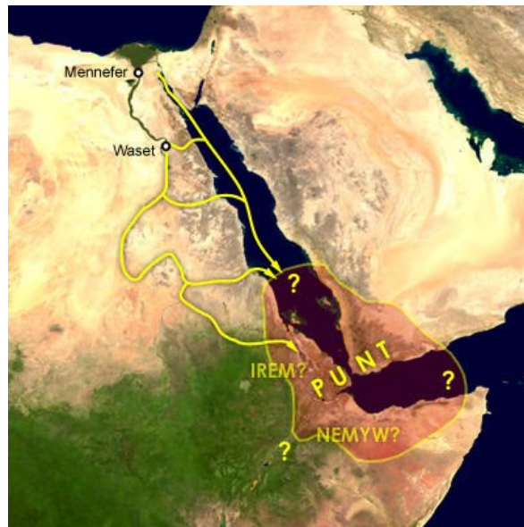
Možná lokace země Punt podle mudlovského umělce.

se jim Punt svou velikostí určitě nemůže rovnat a jeho přibližná lokace není obestřena takovým tajemstvím. Je toto ale dobrá cena, za kterou mudlové (a vlastně i kouzelníci) zaplatili chybějící znalosti o národu Puntů?